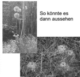
So könnte es dann aussehen

Wir Imkerinnen und Imker danken ihnen. Ihre Fotos und Beschreibungen können Sie auf unserer Home-page www.imker-laupen-erlach.ch hochladen oder senden Sie diese an Imkerverein Laupen-Erlach, Rohrmoos Thal 34, 3177 Laupen.