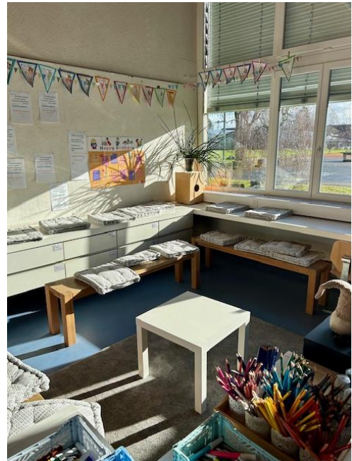
Abbildung 2 Kreis im Klassenzimmer