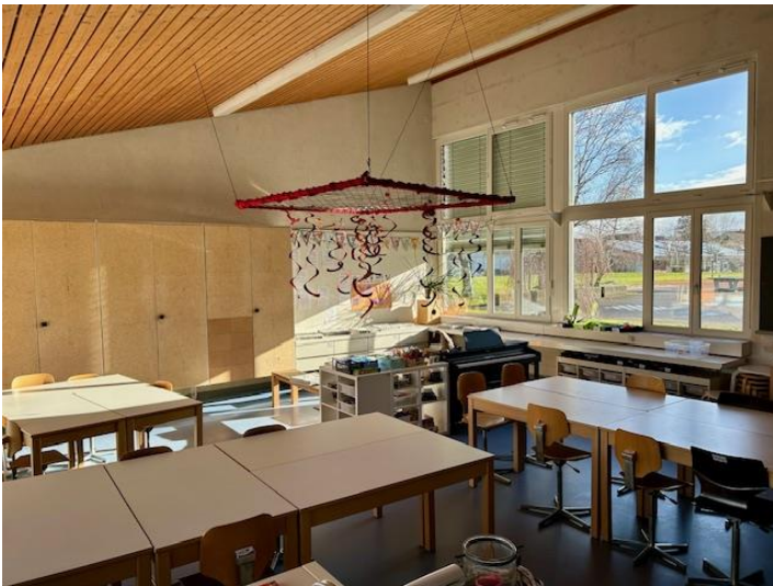
Abbildung 1 Klassenzimmer