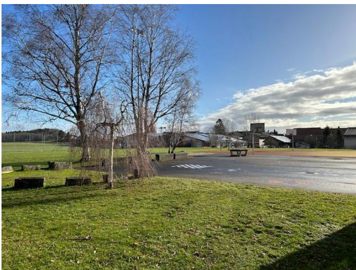
Abbildung 4 Pausenplatz