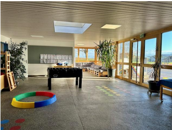
Abbildung 3 Pausenhalle